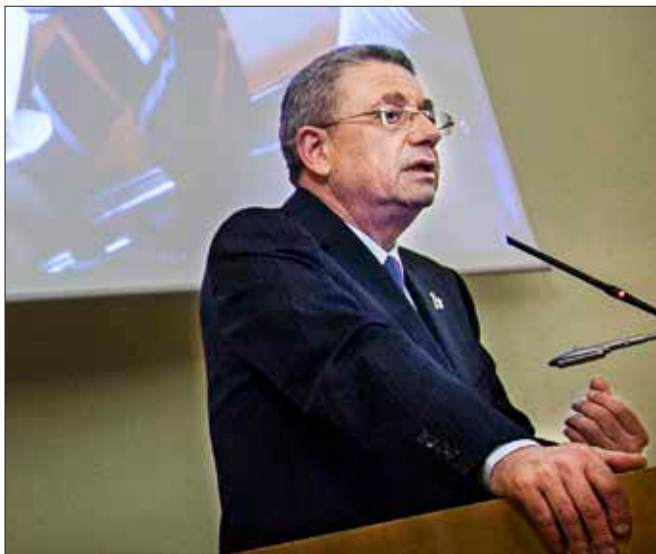
Dr. Mustafa Barghouti á fyrirlestri um málefni Palestínu í lok árs 2012.

Stjórnmálafræðideild HÍ leggur áherslu á að kennarar deildarinnar rækta sem best alþjóðlegt rannsókn- og fræðasamstarf. Kennarar í framhaldsnámi deildarinnar eiga þannig aðild að fjölmörgum norrænum, evrópskum og alþjóðlegum samstarfsverkefnum, sem nýtast nemendum í framhaldsnámi með margvíslegum hætti. Auk þess geta nemendur sótt hluta af námi sínu við erlenda háskóla eins og fram kemur annars staðar í þessum bæklingi.