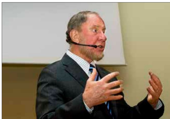
Robert D. Putnam stjórnmálafræðingur, prófessor við Harvard, Kennedy School of Government í fyrirlestri 2011 í HÍ.