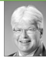
Dr. Ólafur Þ. Harðarson Ph.D. í stjórnmálafræði, prófessor.